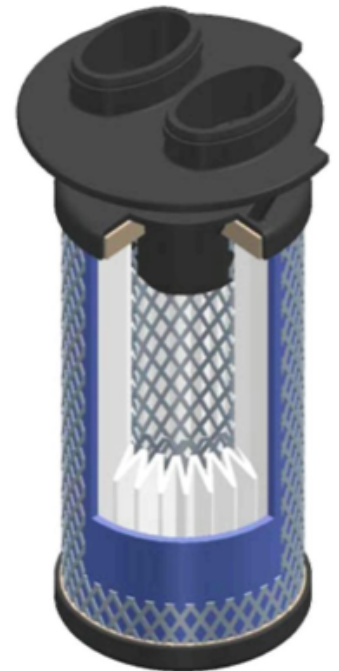
Поперечный разрез глубинного фильтра